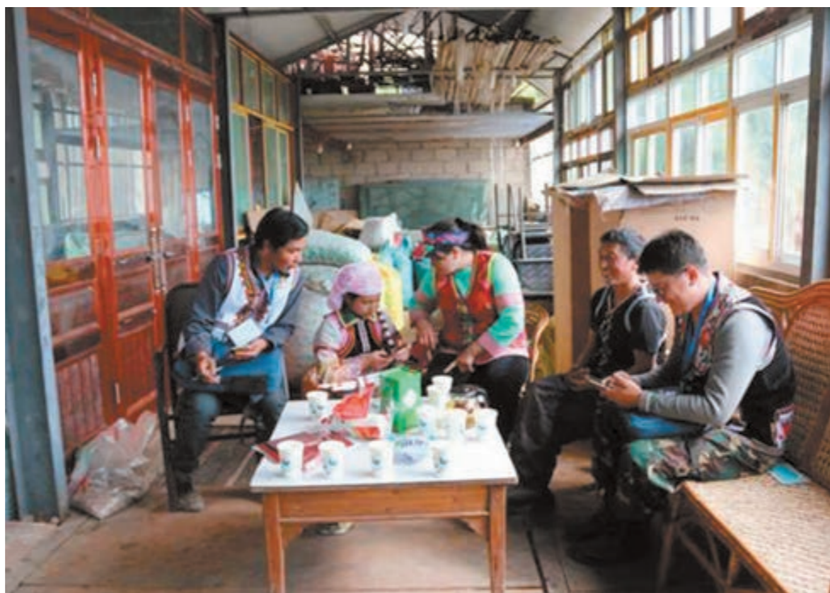
当前,第七次人口普查工作已进入长表登记阶段,凤庆县新华乡人普办提前谋划工作,选定5名会讲苗族语言、了解苗族民俗的人员担任普查员,进一步做好辖区内少数民族人口普查服务工作,全面掌握少数民族人口数量及分布情况。图为普查员在苗家村寨求真务实做好人口普查工作。

会议指出,近年来,各地区、各有关部门加强组织领导,完善制度机制,强化执法检查,欠薪问题多发高发态势得到有效遏制,特别是今年以来,以贯彻实施《保障农民工工资支付条例》为抓手,推动各项工资支付保障制度落实落地,妥善解决各类欠薪问题,根治欠薪工作取得新进展。